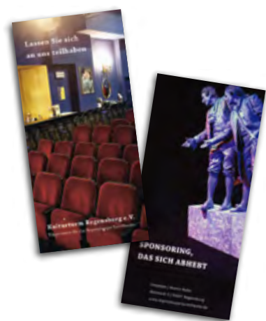
Broschüren direkt im Theater oder zum Download auf unserer Webseite.

Als Sponsor unterstützen Sie Ihr Unternehmen den Erhalt so wie die Entwicklung des Turmtheaters und profitieren im Gegenzug von interessanten Sponsoringangeboten. Wählen Sie selbst den gewünschten Rahmen und transportieren Sie ein Image, das Sie von Ihren Marktgeleitern abheben wird.