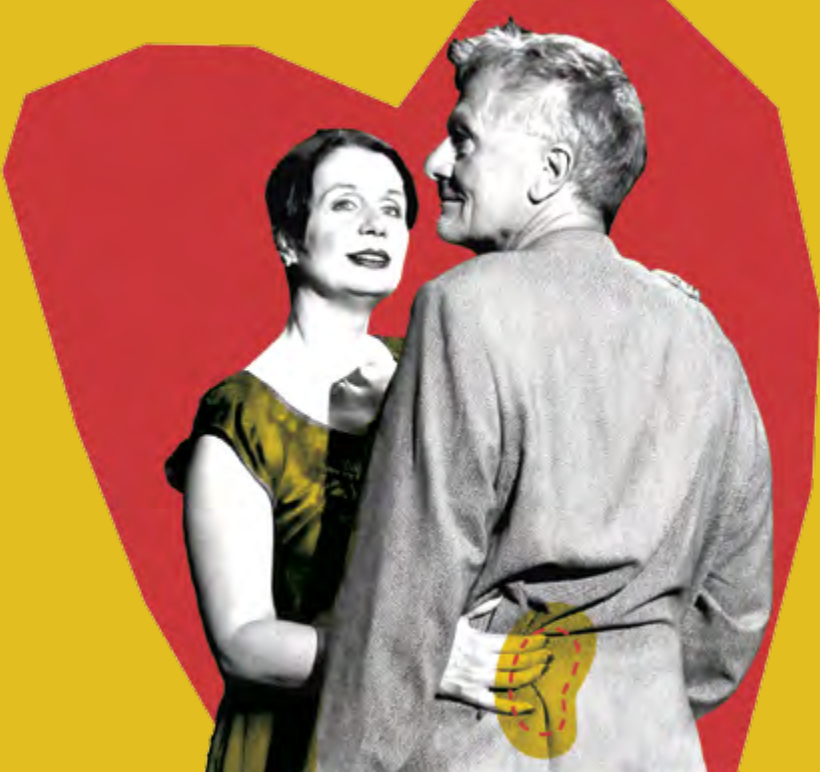
Titelbild: »Die Niere«