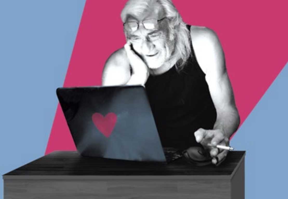
Titelbild: »Monsieur Pierre geht online«