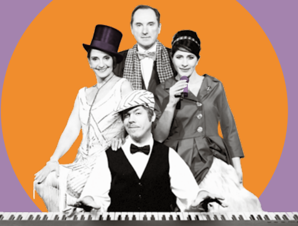
Titelbild: »Wunder gibt es immer wieder«