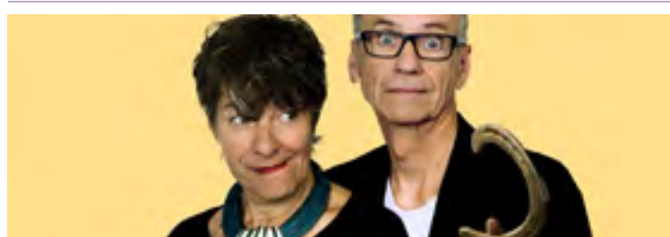
FALTSCH WAGONI – »ZUM GLÜCK!« Wortverspielt, valentinesk, poetosopisch und sehr musikalisch

Glück, das ist einfach eine gute Gesundheit und ein schlechtes Gedächtnis, meinte einst Hemingway. Nicht schlecht. Vergessen wir doch einfach mal, was uns gerade die Stimmung vermiest und lassen uns von den satirischen Geistesblitzen à la Faltsch Wagoni beglücken. Erfahren werden wir allerdings nicht wie wir glücklich werden, sondern, dass wir es womöglich schon sind.