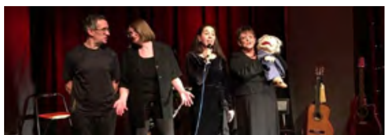
ZUM STERBEN SCHÖN Ein musikalischer Kabarettabend zum Weinen und zum Lachen